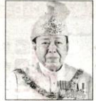
雪兰莪州苏丹 沙拉夫丁