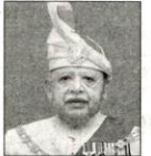
玻璃市拉惹 端姑赛西拉祖丁