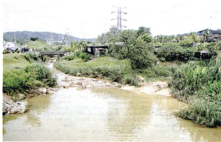
Right now, they (Air Selangor) are relying solely on river water, but what they can do is to have alternative water sources, says expert

The recent water woes in Selangor came following the shutdown of four water treatment plants in