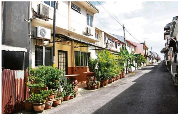
Back lanes that are clean, well-lit and pedestrian-friendly may help prevent break-ins.

"While we understand that homeowners have reasons for blocking entry and exit points, their actions have caused problems for others.