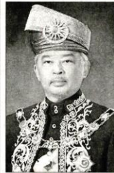
国家元首 苏丹阿都拉