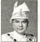
霹靂州苏丹 纳兹林沙