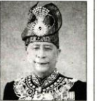
吉打州苏丹 端姑沙烈胡丁