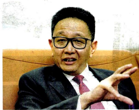
Selangor is the only state to launch 2 major online voucher campaigns back-to-back to accelerate the digitalisation of SMEs during this critical moment, says Teng

"Selangor is the only state to launch two major online voucher campaigns back-to-back to accelerate the digitalisation of SMEs during this critical moment," he said in a statement yesterday.