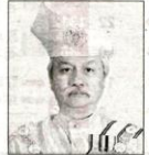
森美兰最高统治者 端姑慕赫力兹