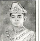
彭亨州摄政王 东姑哈沙纳依布拉欣

肺炎疫情持续蔓延。 陛下也强调，即将在国会提呈的《2021年财政预算案》对人民非常重要，以对抗新冠肺炎疫情和恢复国家经济。此外，前线人员也继续拨款，以执行他们的任务和责任。