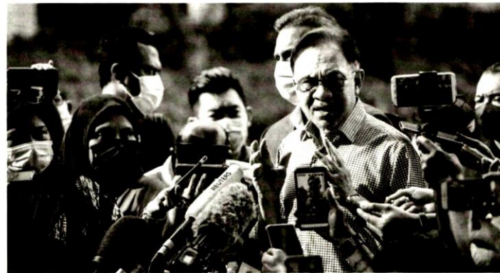
ANWAR Ibrahim bercakap kepada wartawan selepas memberi keterangan kepada polis berhubung senarai nama ahli Parlimen yang menyokongnya di Kuala Lumpur, baru-baru ini.

Ketika itu, Anwar ghairah menuntut apa yang dikatakan sebagai janji Tun Dr. Mahathir Mohamad untuk menyerahkan jawatan Perdana Menteri kepadanya