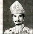
登嘉楼州苏丹 米占再纳阿比丁