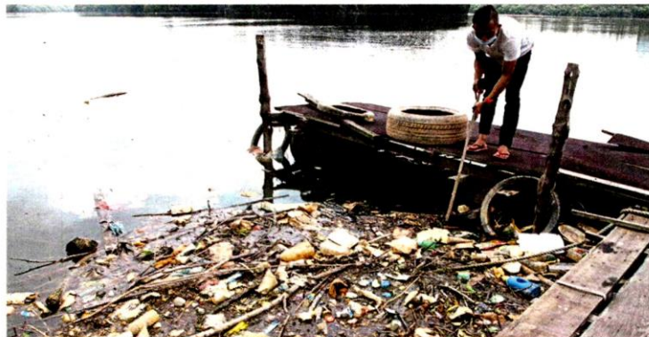
Rivers, like this Sungai Tebrau in Johor, have become dumping grounds for all kinds of waste.