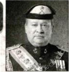
柔佛州苏丹 依布拉欣