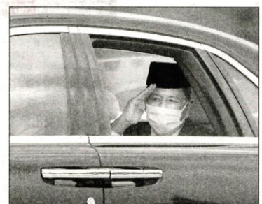
吉打州苏丹端姑沙烈胡丁陛下在抵达王宫时，向媒体们挥手示意。

不过，有关消息传出后，即引起反对声浪。除了在野党全力抨击慕尤丁和内阁落实紧急状态的提议不负责任外，多个非政府组织也都提出反对。